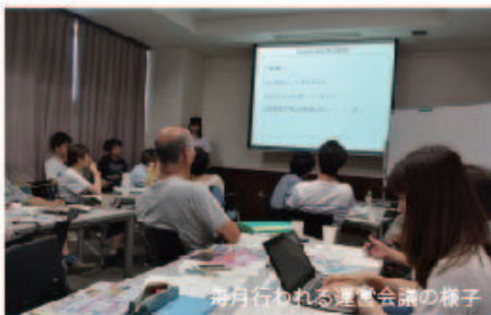
毎月行われる運営会議の様子

毎月市民と学生が一同に集まり、各班の情報共有する会議を行っています。今年度は会議前にミニゲームを取り入れ、市民と学生のチームワークを高めています！